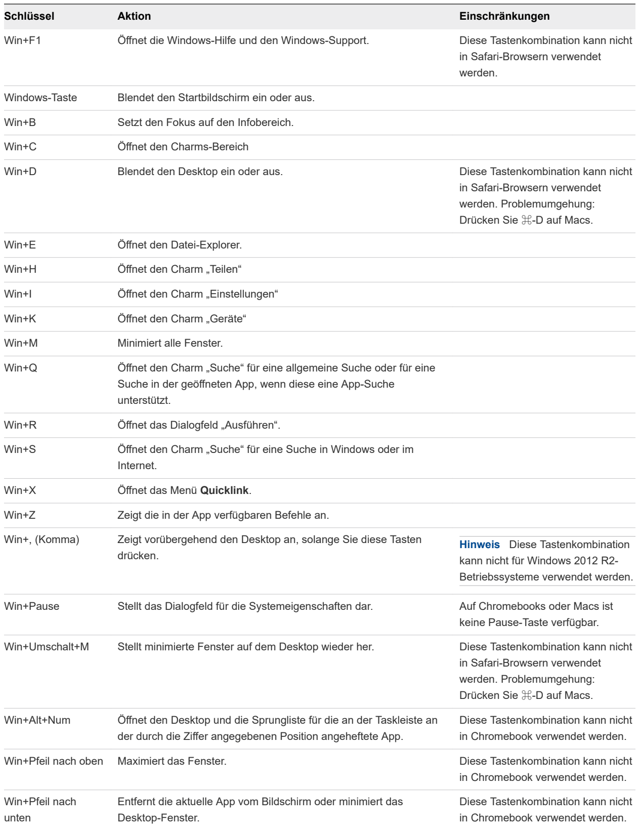
Tabelle 3-4. Windows-Tastenkombinationen für Windows 8.x- und Windows Server 2012 R2-Remote-Desktops