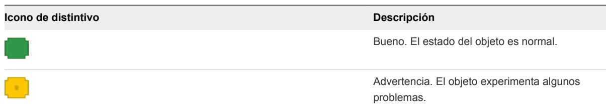
Tabla 6-1. Estados de mantenimiento

Puede ver los distintivos de estado de mantenimiento de los servicios y nodos.