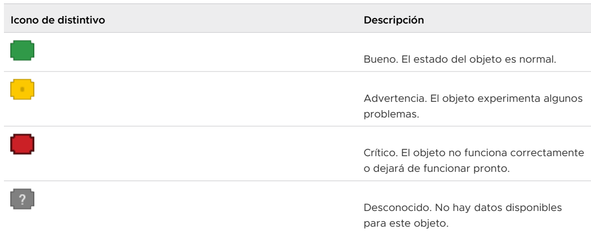
Tabla 3-3. Estados de mantenimiento