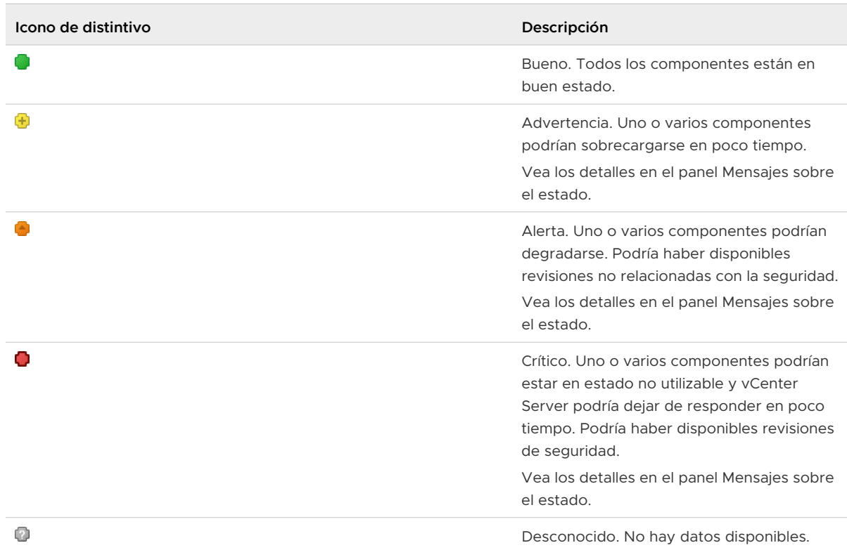
Tabla 2-1. Estado de mantenimiento