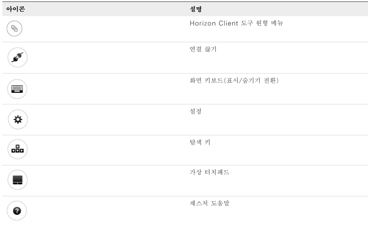
표 4-6. 원형 메뉴 아이콘