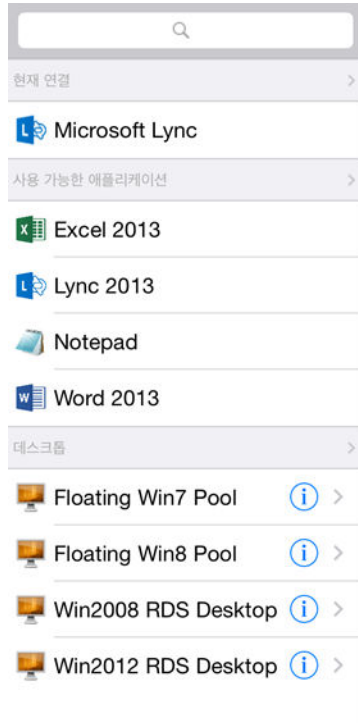
그림 4-2. 게시된 애플리케이션에 대한 Unity Touch 사이드바

Unity Touch 사이드바를 통해 게시된 애플리케이션에서 여러 작업을 수행할 수 있습니다.