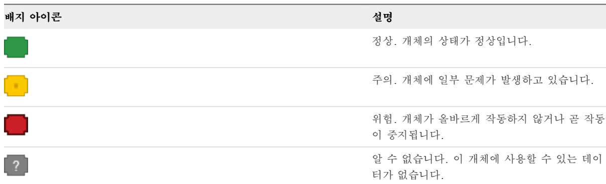
표 6-1. 상태