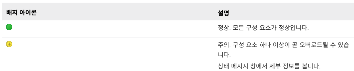
표 2-1. 상태