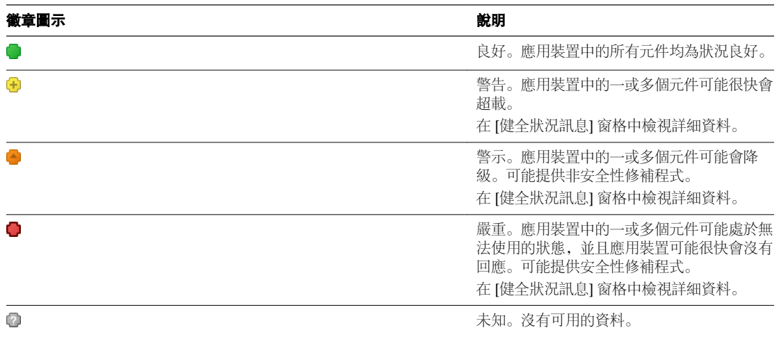
表格 2-1. 健全狀況狀態