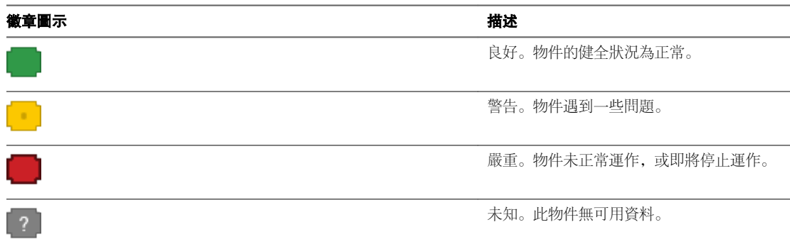
表格 3-2. 健全狀況狀態