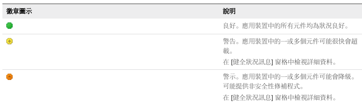
表格 2-1. 健全狀況狀態