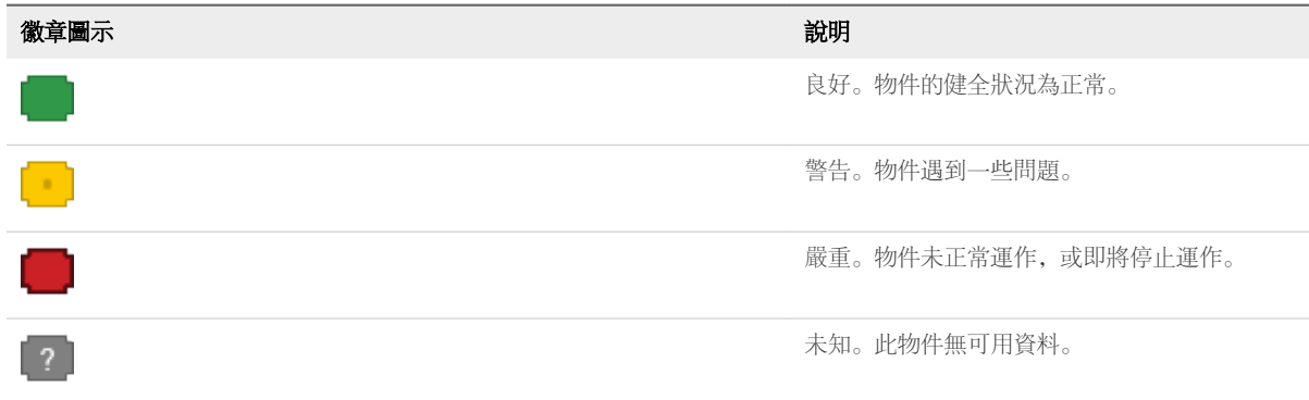
表格 3-2. 健全狀況狀態