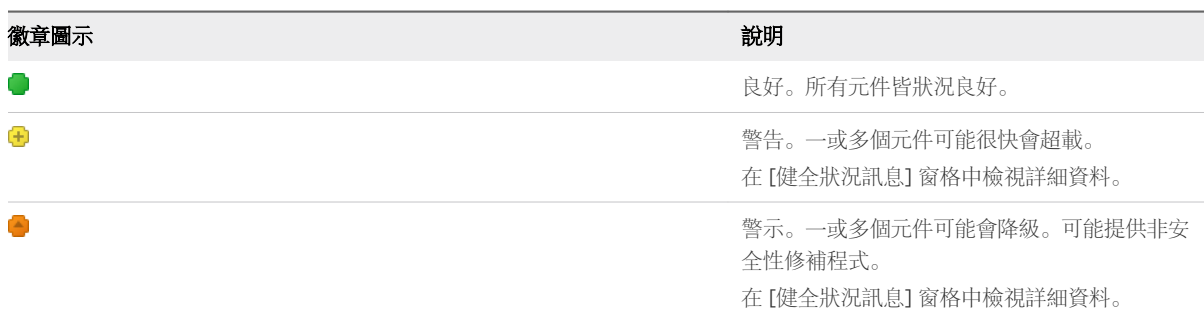
表 2-1. 健全狀況狀態