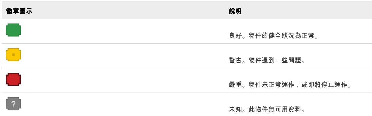
表 3-3. 健全狀況狀態