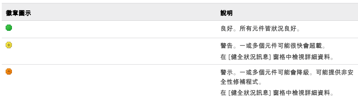
表 2-1. 健全狀況狀態