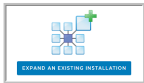
圖 4-4. [安裝] 畫面的 [展開現有的安裝]

備註 請勿從外部或透過 vRealize Operations Manager 介面以外的任何方式關閉線上叢集節點。從外部關閉節點的前提是，先在 vRealize Operations Manager 介面中使該節點離線。