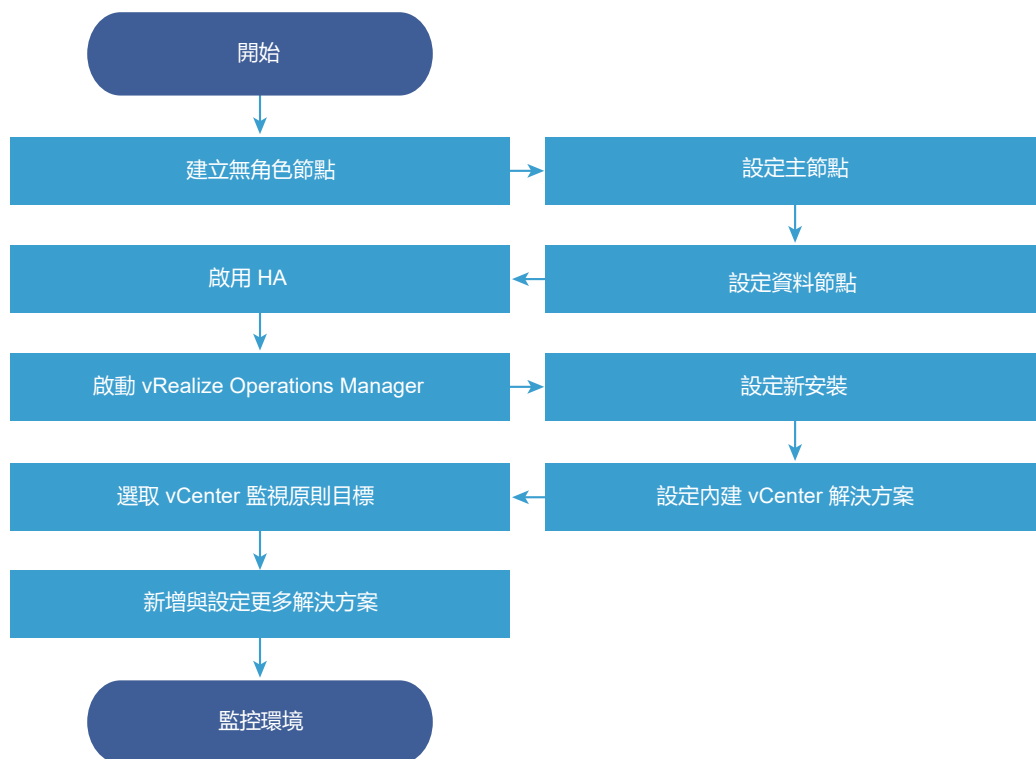
圖 5-1. 工作流程 - 調整叢集大小

您可以部署並設定額外的節點，讓 vRealize Operations Manager 可以支援更大的環境。