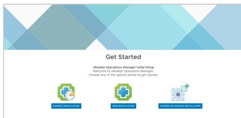
圖 4-1. 安裝入門